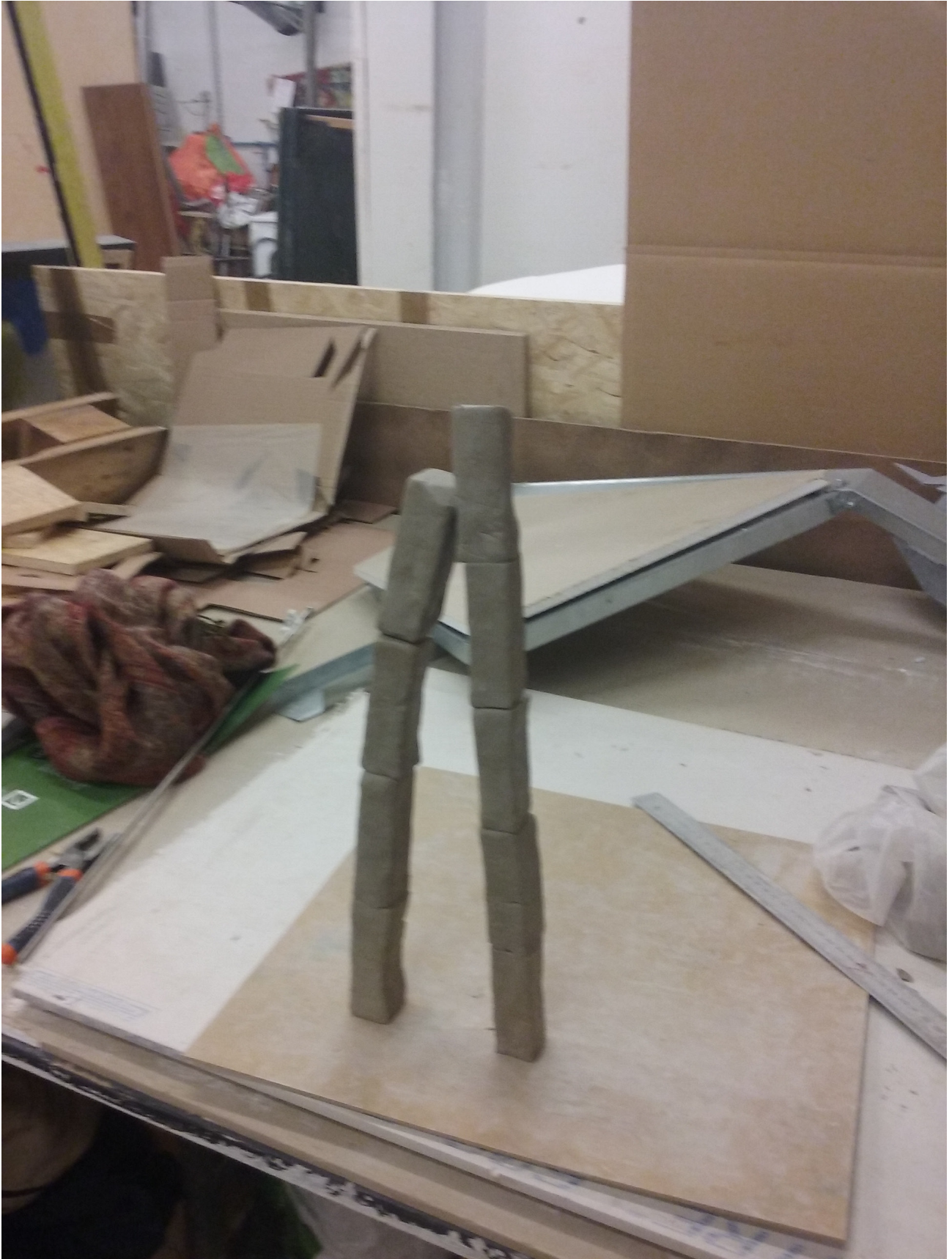
Maquette de la forme en terre, atelier

Le son tourne autour de la terre, comme si il était créateur de forme. Le spectateur est témoin d'une action qui pourrait se dérouler face à lui. Rien ne se passe, tout est en devenir.